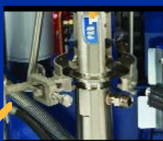
Система ProConnect в ОТКРЫТОМ виде с подключенным насосом.