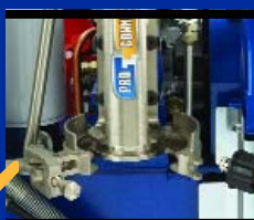
Система ProConnect в РАЗОБРАННОМ виде без подключенного насоса.