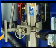
Система ProConnect™ в ЗАКРЫТОМ виде с подключенным насосом.